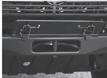
Koppelmaul mit klappbarem Kennzeichenhalter