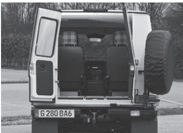
Hecktüre zweiflügelig mit zwei Fenstern