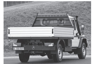
Stahlpritsche mit Alubordwänden