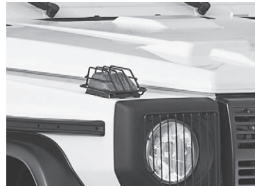
Scheinwerfer mit Gitter