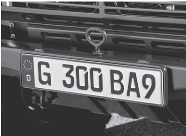
Koppelmaul mit verstärkter Stoßstange