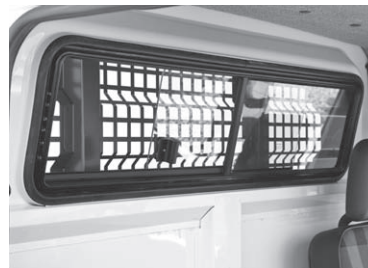
Fenster Rückwand hinter Fahrer, schiebbar